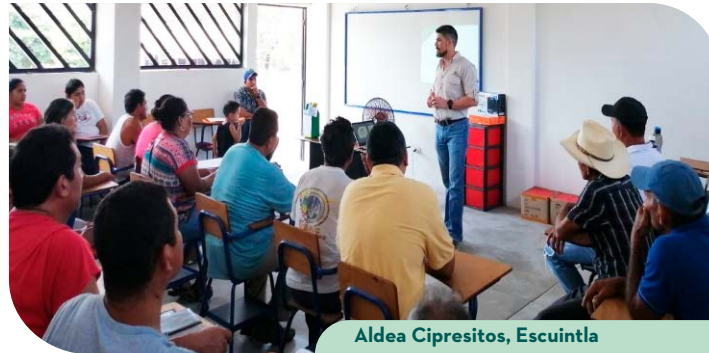
Aldea Cipresitos, Escuintla

Hasta diciembre de 2020, el programa educativo GremiEscuelas ha capacitado a más de 600 personas, entre técnicos docentes de DIGEEX y alumnos de las áreas con vocación agrícola del Ministerio de Educación, llegando a beneficiar a 1,800 personas.