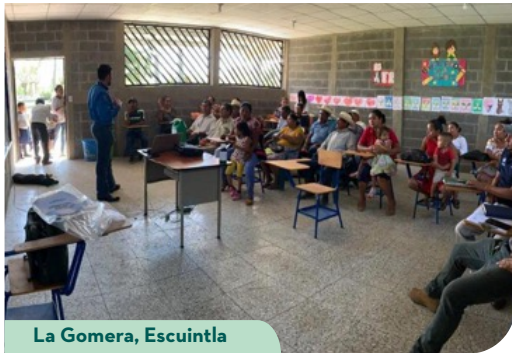
La Gomera, Escuintla